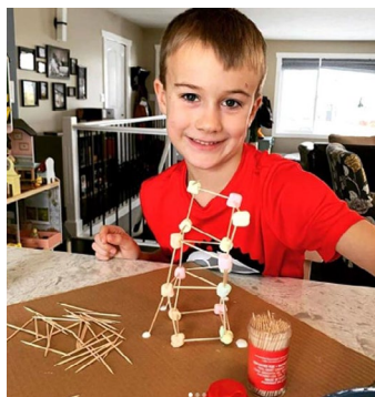
À l'aide de cure-dents et de mini-guimauves, ce louveteau a construit la plus haute tour sans qu'elle ne s'écroule.