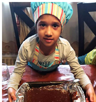
Un castor à queue bleue du groupe #163rd111ScoutsGroup travaille sur son badge de chef en faisant des brownies triple chocolat. Ils ont l'air délicieux!