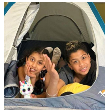
Les scouts ont continué de se pratiquer à monter leur tente à l'intérieur.