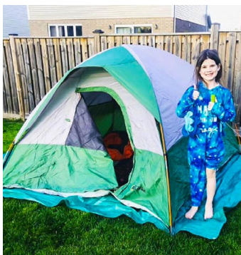
Camping dans la cour arrière.

Les jeunes ont pu rester actifs et engagés grâce à notre programme du Scoutisme à la maison qui leur a offert 15 semaines de plaisir, de jeux et d'aventures. Avec un nouveau thème passionnant chaque semaine, les familles ont pu accéder à des tonnes de jeux et d'activités pour que les jeunes puissent poursuivre leur aventure scoute.